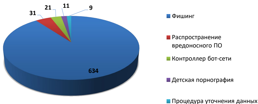
Рис.2 Распределение доменов по видам вредоносной активности (июль 2019)

Анализ доменов-нарушителей по типу выявленной вредоносной активности в отчетном периоде показал, что лидирующее место принадлежит доменным именам, связанным с фишингом (634 обращения). Далее следуют ресурсы, используемые для распространения вредоносного программного обеспечения (31 обращение), контроллеры бот-сетей (21 обращение) и ресурсы для распространения материалов с порнографическими изображениями несовершеннолетних (11 обращений). Также, 9 обращений были направлены компетентными организациями, с просьбой инициировать проверку идентификационных сведений администратора.