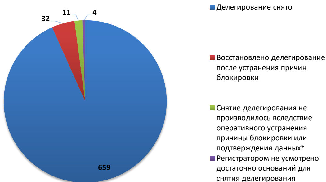
Рис.3 Итоги обработки обращений о снятии делегирования (июль 2019)

За отчетный период по обращениям компетентных организаций были сняты с делегирования 691 доменное имя. Для 11 доменных имен снятие делегирования не потребовалось вследствие оперативного устранения причин блокировки администратором домена (или ресурс был заблокирован хостинг-провайдером) или своевременного подтверждения администратором домена идентификационных данных. В 4 случаях, регистратором не усмотрено достаточно оснований для снятия делегирования или инициирования проверки администратора.